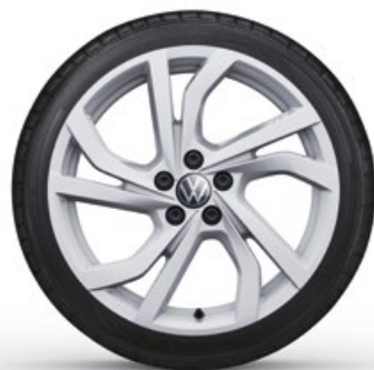
17" Lichtmetalen velg 'Tortosa'