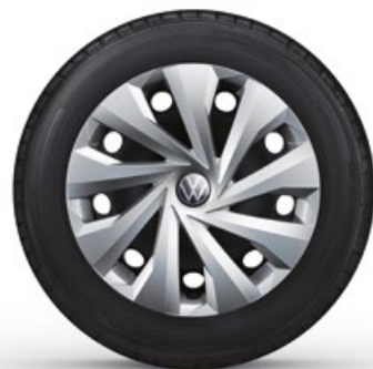
15" Stalen velg 'Tortosa'

Optioneel op de Polo en standaard op de Polo Life