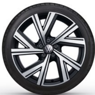
17" Lichtmetalen velg 'Bergamo'