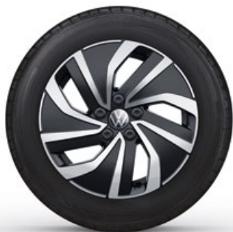
15" Lichtmetalen velg 'Essex'

Optioneel op de Polo en standaard op de Polo Life