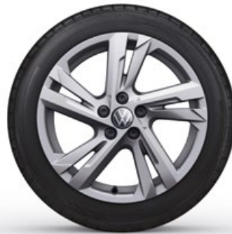
16" Lichtmetalen velg 'Valencia'