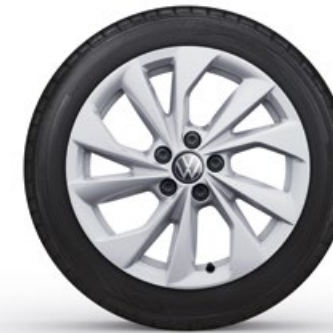
16" Lichtmetalen velg 'Palermo'