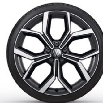
18" Lichtmetalen velg 'Faro'