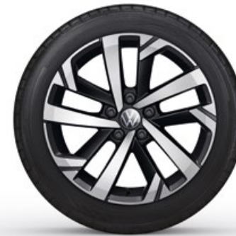
16" Lichtmetalen velg 'Torsby'