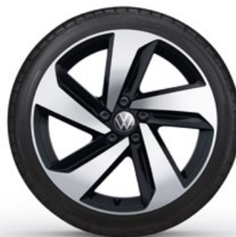
17" Lichtmetalen velg 'Milton Keynes'